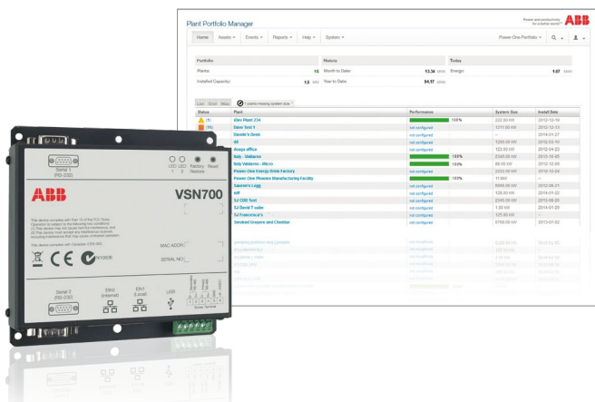
VSN700 Data Logger et interface utilisateur web